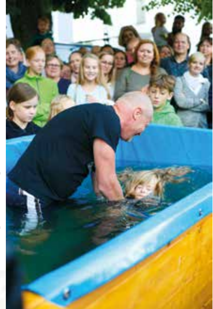
Die Fotos sind vom Tauffest auf dem Sedamplatz im September 2019

Im Anschluss können alle Tauffamilien an vorbereiteten Tischen die Taufe feiern mit mitgebrachten Speisen und Getränken. In der Marktkirche wird ein Kuchenbuffet aufgebaut. Ein Kinderprogramm wird angeboten.