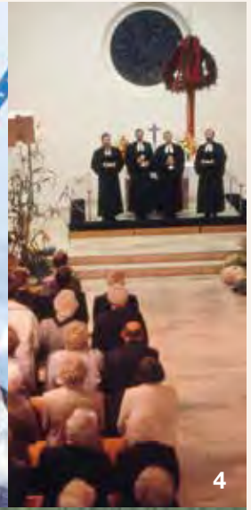
Fotos auf Seite 22: 1. 1986 Ordination/2. 1987 Gemeindefest/3. 1987 Gemeindefest/4. 1988 Predigt/5. 1988 Einführung/6. 1988 Begrüßung/7. 1990 Auerbach/8. 1990 Segeln/9. 1994 Gherla (Rumänien)/10. 2002 Skifreizeit