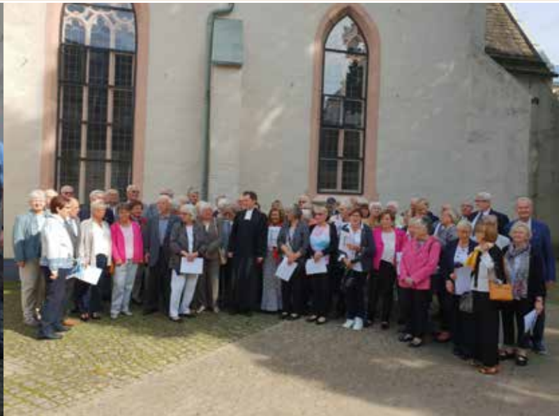
Jubelkonfirmationen vor der Marktkirche, oben: am 3. September, links am 10. September